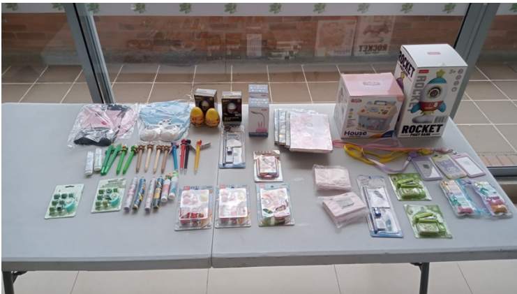
La administración compró directamente en San Victorino los regalos para la fiesta de los niños

Y le pediremos a Asoalcalá la misma maquina de fotos del año pasado que creo que a la gente le gustó mucho por que se quedaron con una foto impresa.