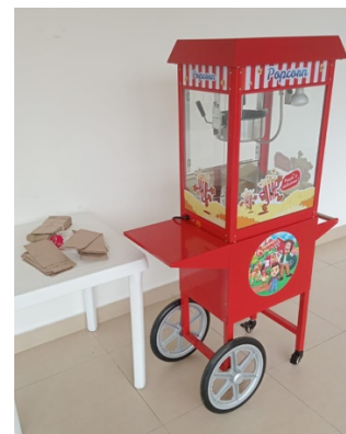
Se alquiló el servicio de crispetera