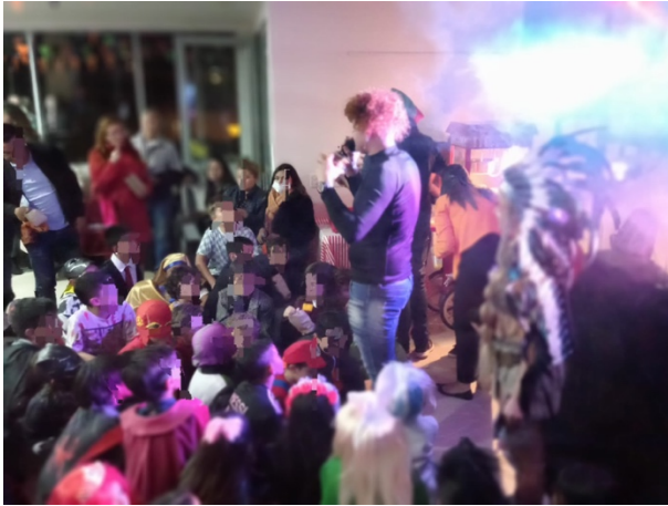
Se contrató el servicio de animación