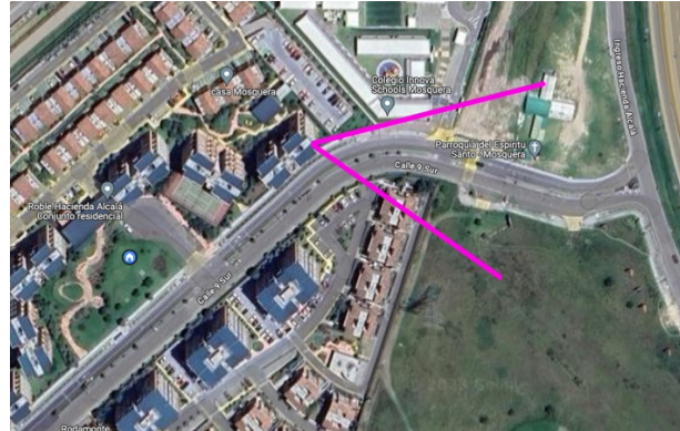
En Roble se cubriría la entrada y salida vehicular

Se gestionó con la asociación la instalación de una cabaña de reciclaje a la entrada de Hacienda Alcalá