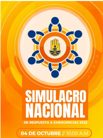
Se envió la invitación a todos los residentes

EL miércoles se realizó un simulacro de evacuación a las 10am. Durante 15 a 20 min las alarmas del conjunto sonaron para indicara los residentes que debían evacuar el inmueble, dirigirse al primer piso y salir de casas y torres, sin correr.