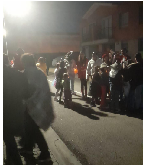
En varias ocasiones se detuvo personas en portería que querían ingresar al conjunto sin ser invitados por algún residente

En total el reporte de los guardas es que un poco mas de 70 personas se acercaron a portería con intención de pedir dulces dentro de Roble y se les negó el ingreso, ya que no tenían invitación de ningún residente.