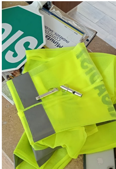
Se compró dotación necesaria para los guardas y personal de aseo, para colaborar en la actividad