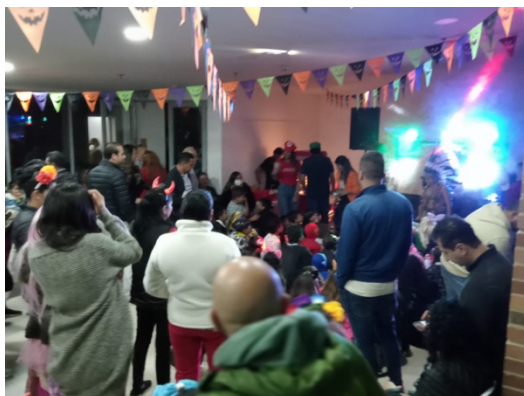
La fiesta se desarrolló en el salón social