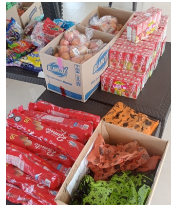
También se compraron los alimentos para los refrigerios