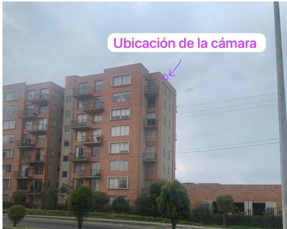
La Cámara se ubicará en el ultimo piso de la torre 6 y cubrirá la entrada y salida de la hacienda. Desde la esquina superior de la torre