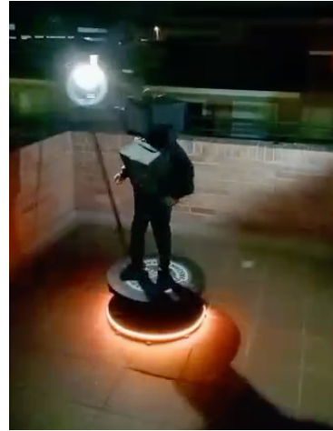
Se contó con la grabación 360 y cámara de fotos provista por Asoalcalá